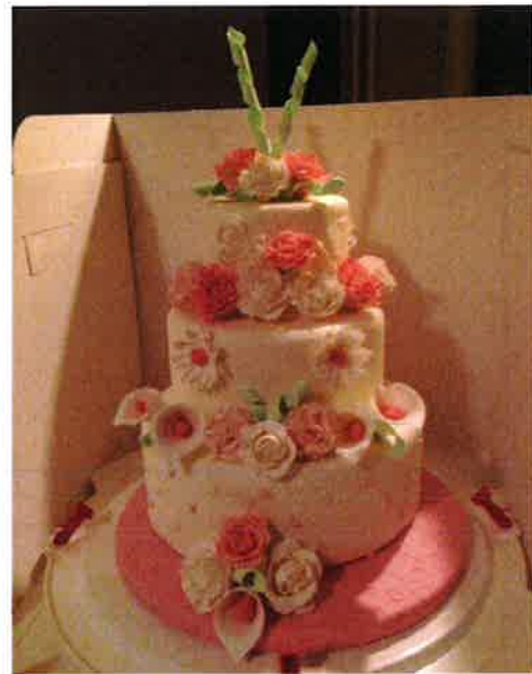
Een bruidstaart van meerdere lagen.

In overleg valt voor elke gelegenheid iets te maken. Te denken valt aan kleine en grote taarten, cupcakes en traktaties. In elk denkbaar thema kan iets gemaakt worden. Angelique heeft een speciale printer die op eetbaar papier of witte chocolade kan printen. Thema's die al eens uitgevoerd zijn, zijn Feyenoord, de boerderij, een tietentaart, Walt Disney figuren, Hello Kitty, paarden, een geboortetaart, een bruidstaart en nog veel meer.