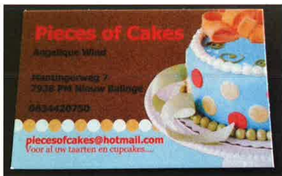
Het visitekaartje van Angelique.

Binnenkort zal er een logo ontworpen worden en ook komt er te zijner tijd een website.